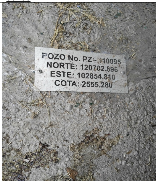
Foto 3. Placa de identificación del pozo pz-11-0095

El día de la visita, se realizó un recorrido en donde se evidenció que el pozo pz-11-0095 encuentra sellado definitivamente, este está ubicado en la huerta ubicada en el ala norte del predio. En sus alrededores no se identificó ninguna actividad ni almacenamiento que representara riesgos al acuífero por infiltración o escorrentía. Quien atendió la visita insistió en que se han realizado en varias ocasiones visitas al punto, el cual se encuentra sellado definitivamente y que en todas las visitas se había identificado un estado ambiental bueno para los alrededores del pozo. Como se observa en la fotografía No. 2, el pozo se encuentra desmantelado y no cuenta con sistemas para la explotación del recurso hídrico subterráneo.