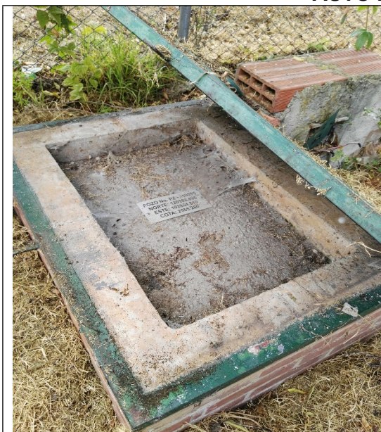
Foto 2. Ubicación de la Caja del Pozo pz-11-0095, sellado definitivamente.